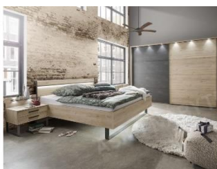
Spálňová zostava a Brüssel