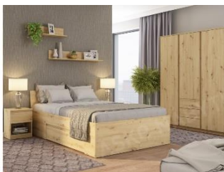
Nábytková zostava Carlos