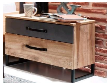
Set nočných stolíkov Detroit, 239,92 €