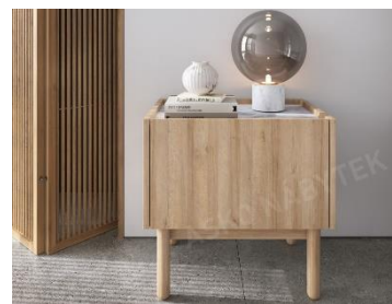
Nočný stolík Boho, 78,32 €