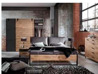
Spálňová zostava Detroit