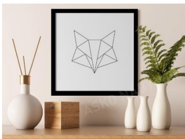
Rámovaný obraz Líška, 11.99 €

Škandinávsky dizajn je stále obľúbený pre svoju jednoduchosť a funkčnosť. V spálňach sa prejavuje prostredníctvom svetlých drevených podláh, bielych stien a jednoduchého, ale pohodlného nábytku.