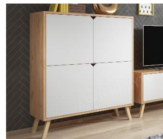
Skrinka 4-dverová Tokio, 252,72 €