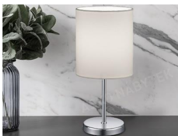
Stolná lampa Jerry, 10,39 €

Prírodné materiály ako drevo, ratan, bambus alebo látka z ľanového vlákna hrajú v minimalistickom dizajne kľúčovú úlohu. Ich prirodzená textúra a farebnosť dodávajú priestoru teplo a príjemnú atmosféru. V spálni môžete využiť drevený nábytok, ratanové koše na úschovu, bambusové rohože alebo koberce. Tieto prvky nielenže prinášajú pocit harmónie s prírodou, ale zároveň podporujú udržateľný prístup k bývaniu.